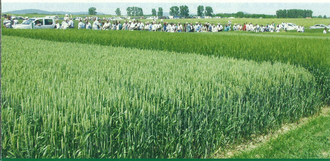
A tizenhatodik szabolcsi bemutatón több, mint háromszázan vettek részt

Újra terjedni kezdtek különböző gyomnövények, és ez igaz a kalászos állományokra is. Ismét megjelent a táblákon a konkoly, ami ellen azért is kötelező a fellépés, mert a magja mérgező. Korábban, amíg a Dikonirtot használták, ez a gyomnövény eltűnt, de napjainkra ismét megjelent, úgyhogy érdemes rá jobban odafigyelni. Az egyszikű gyomnövények közül a széltippan és a rozsok okoz gondot. Mind-