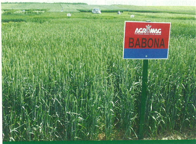
Babona: középérésű minőségi őszi búza

A Szabolcs községben beállított kísérleteikben összesen 65 parcellán tekinthették meg a különböző gabonaféléket. Őszi búzából 48-at, őszi árpából 12-t, tritikáléból ötöt mutatnak be. A kísérleti parcellákat október 28–29–30-án vetették el. Az azóta eltelt hónapok a sokévi átlagnál kevesebb csapadékot hoztak. Az is megtörtént, hogy a település egyik szélén – és a kísérleti táblák egyik sarkában – 55 milliméte-