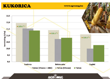
1. ábra: A Temes terméseredményei különböző csávázószer használata során két év és három kísérleti hely átlagában (forrás: Agromag Kft. kisparcellás kísérletei 2017-2018)

Idén lesz harmadik éve, hogy az Albittal csávázószerként kísérletezünk. A célunk ezzel a kezeléssel, hogy támogassuk a növényeket a kezdeti fejlődésükben és a gombaölös csávázást kiegészítve tovább csökkentjük a csírákori betegségeket. Mindemellett az Albitos csávázásnak termésmenővelő hatása is van (1. ábra).