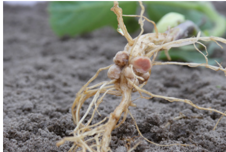
2. ábra: Gümmök a négyhetes Terrapro gyökerén

2017-ben eljuttattunk natúr és Liquifix 120-szal oltott Sekát a Dr. Szabó AgroKémia Kft. Jó Gazda Program keretei között folyó szója hozamkísérletbe. A Seka nagyon jól reagált az oltásra, 7 mázsás termésmenővel eredményezett a Liquifix 120-szal történő kezelés (3. ábra).