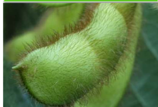
NÉBIH szója fajtaösszehasonlító kísérletek, 2021 középérésű csoport